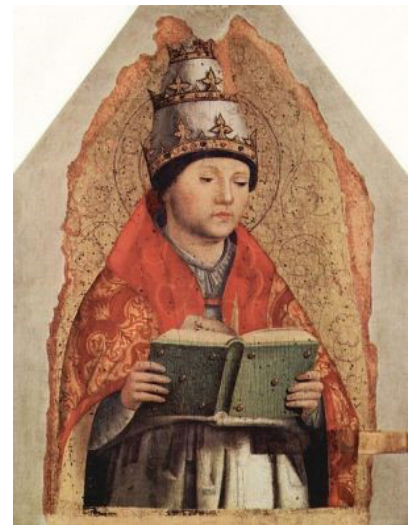
Gregor I. (Idealporträt von Antonello da Messina, um 1472/1473)

Tatkräftig ergriff er als Papst Gregor I. die Zügel und führte bis zu seinem Tode am 12. März 604 vierzehn Jahre lang sein hohes Amt in einer selten aufopfernden, hoch verantwortungsbewussten, lauterer und kraftvollen Weise. Er wurde später zu einem Heiligen der röm.-kath. Kirche ernannt. Diesem Papst Gregor dem Großen, werden große Verdienste um den Kirchengesang und um die Reform der Liturgie durch den heute noch grundlegenden „Gregorianischen Gesang und Choral“ zugeschrieben. Er gründete eine Reihe von Klosterschulen, die ihre Hauptaufgabe darin sahen, den Kirchengesang zu pflegen. In der römischen Musikschule „schola cantorum“ pflegte man das Singen und musizieren und nahm sich besonders der Waisenkinder an und ließ sie am Bildungsgeschehen teilhaben. Dadurch erhielt der Schulunterricht bedeutungsvolle Akzente und kam zu großen Ehren. Papst Gregor I. war ein treuer Freund der Jugend. Deshalb wurde er zu ihrem Schutzpatron und zum Schulpatron erkoren und deshalb wurde er auch zum Namenspatron des weitverbreiteten Gregorifestes. Darüber hinaus aber war Gregor I. größter Verdienst die Ausbreitung des Christentums unter den Angelsachsen in Britannien, wohin er 596 den Benediktiner-Abt Augustinus, den Apostel der Angelsachsen sandte.