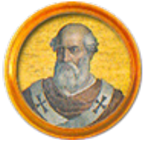
Papst Gregor der Große

Das Gregorifest ist ein gewachsenes Heimatfest mit einer traditionsreichen Vergangenheit, das im Bewusstsein der Bürgerinnen und Bürger fest verwurzelt ist. Auch wenn die ein oder andere Stimme äußert, dass dieses Fest nicht mehr zeitgemäß ist, handelt es sich immer noch um ein Schulfest. Auf die häufig gestellten Fragen nach dem historischen Hintergrund dieses Festes, sollen deshalb folgende Erläuterungen nachgereicht werden. Der Ursprung des Gregorifestes reicht weit in das Mittelalter zurück und wird dem Papst Gregor IV. als Gründer zugeschrieben, der 827-844 Oberhaupt der Kirche war und auch das Allerheiligenfest zum 1. November eingeführt hatte. Im Jahre 830 besann sich Gregor IV. auf seinen großen Vorgänger Gregor I. und richtete das Schulfest ein, das den Namen des großen Kirchenführers „Gregorius“ erhielt und ursprünglich auch regelmäßig an dessen Todestag am 12. März 604, dem heutigen Namenstag „Gregor der Große“ gefeiert wurde.